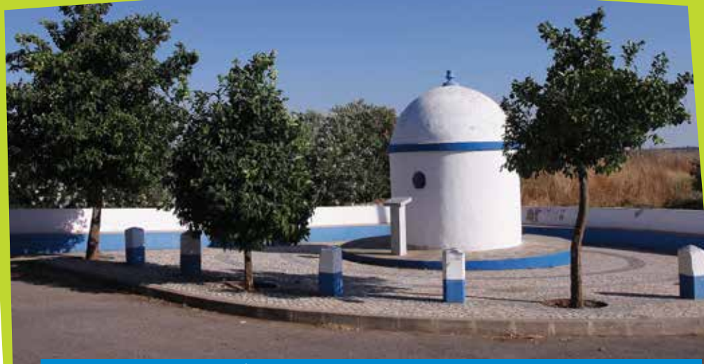
Fonte das Cavadas - É possível que fosse neste local a antiga Fonte Faleira, de propriedade particular

Comece o passeio na estrada que liga a aldeia do Penedo Gordo a Santa Clara do Louredo (Boavista). A pouca distância da primeira encontrará a Fonte das Cavadas (1) , em tempos também chamada a Fonte Faleira, devido à propriedade vizinha da Quinta da Faleira, outrora possuída por uma família de apelido Faleiro. Também a fonte era privada.