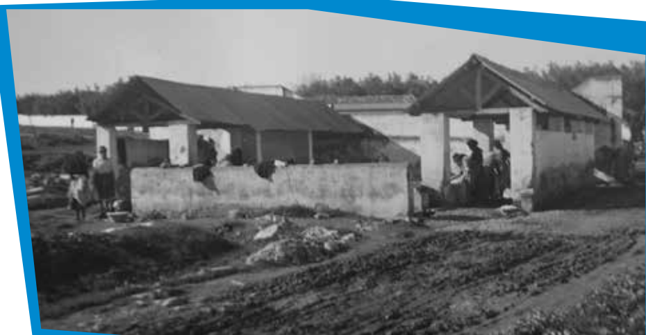
Tanque de lavagem de roupa do Tanque dos cavalos, em 1948

O Tanque dos Cavalos (3) , situado no centro do pequeno bairro de S. João era um dos grandes tanques da entrada da cidade, junto à movimentada estrada para Serpa que, saindo da cidade pela atual Rua Prof. Bento de Jesus Caraça, por aqui passava. O percurso da estrada é do tempo dos Romanos. A existência de um tanque tem pelo menos 500 anos. Aqui se realizava um grande cortejo dos oficiais da cidade no dia de S. João Batista: era a cavalgada da manhã do Batista.