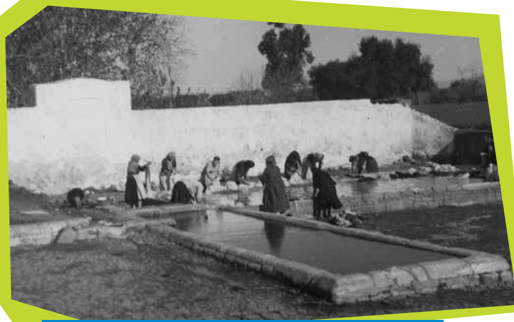
Tanque de lavagem de roupa e bebedouro de animais junto à quinta da Suratesta, em 1941

Termine o percurso contornando a cidade pelo norte e percorrendo a estrada de Évora até à Suratesta (6) , onde encontrará um antiquíssimo ponto de água, com fonte, tanque e chafariz, existindo hoje em dia apenas o bebedouro. Daqui pode regressar à cidade pela antiga estrada de Évora, paralela à moderna, até ao ponto em que esta é interrompida, regressando à via de circunvalação da cidade.