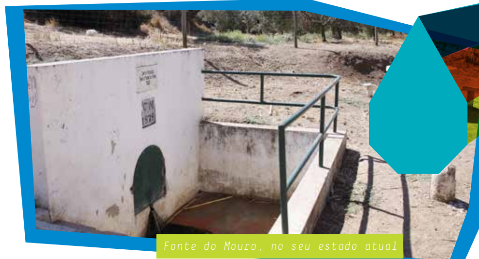
Fonte do Mouro, no seu estado atual

De volta à cidade, pela estrada que liga Serpa a Beja, deve seguir no sentido do Bairro da Esperança, onde se situava o antigo convento do Carmo. Aqui encontrará a antiga estrada de Selmes, que o levará à Fonte do Mouro (5) , lugar povoado de lendas. A fonte foi sofrendo obras ao longo dos tempos.